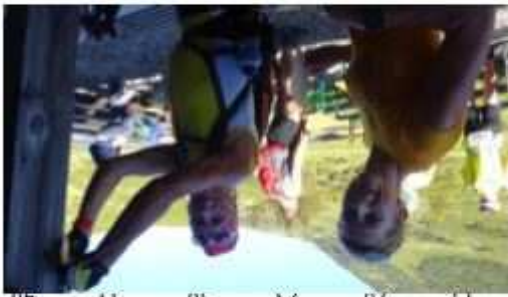
Stempelstele Zolnersee Hütte