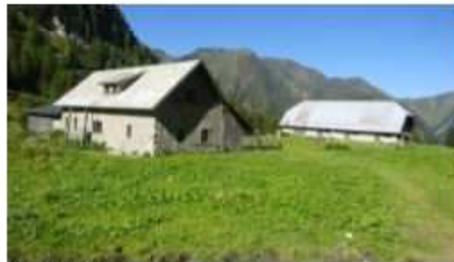
Obere Bischof Alm

10. GRENZGÄNGER WANDERMARATHON Samstag, den 09. August 2025 Start um 06.00 Uhr Anmeldung unter: Grenzgänger Marathon – OEAV Obergailtal-Lesachtal (oav-obergaital.at)