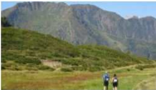
Zolner Alm mit Köderhöhe